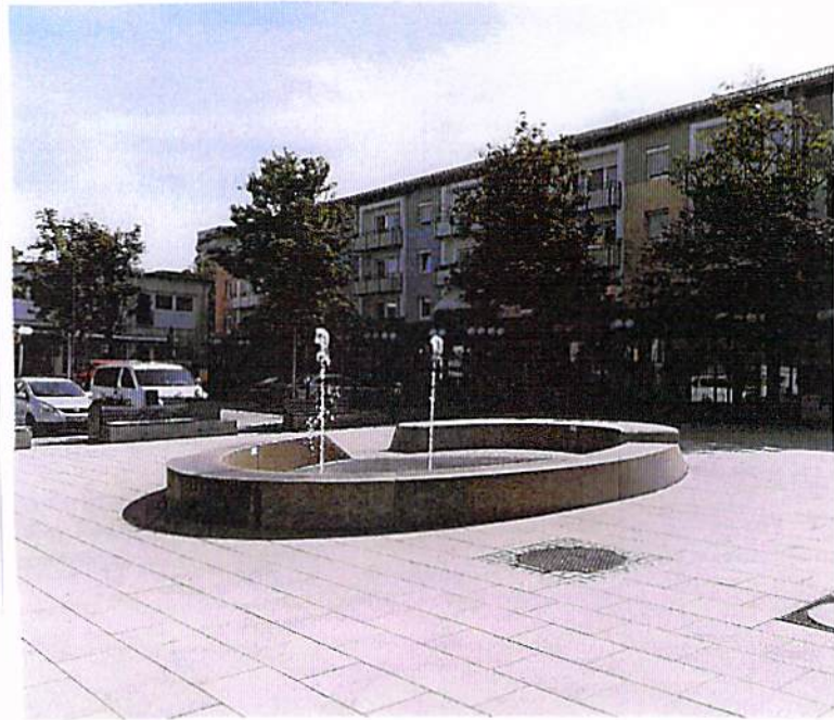
Neuer Platz 24, Geretsried